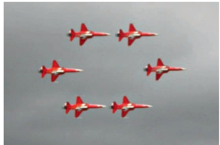
Defilee der Patrouille Suisse am 10. 10. 2011 auf Naters Alp.

Pro Senectute Emmental-Oberaargau und die Gemeindebehörden danken herzlich allen Menschen, die sich in einer Form freiwillig zum Wohle älterer Menschen engagieren.